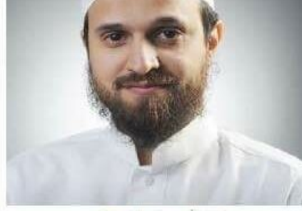
عبدالله سفر الحوالي